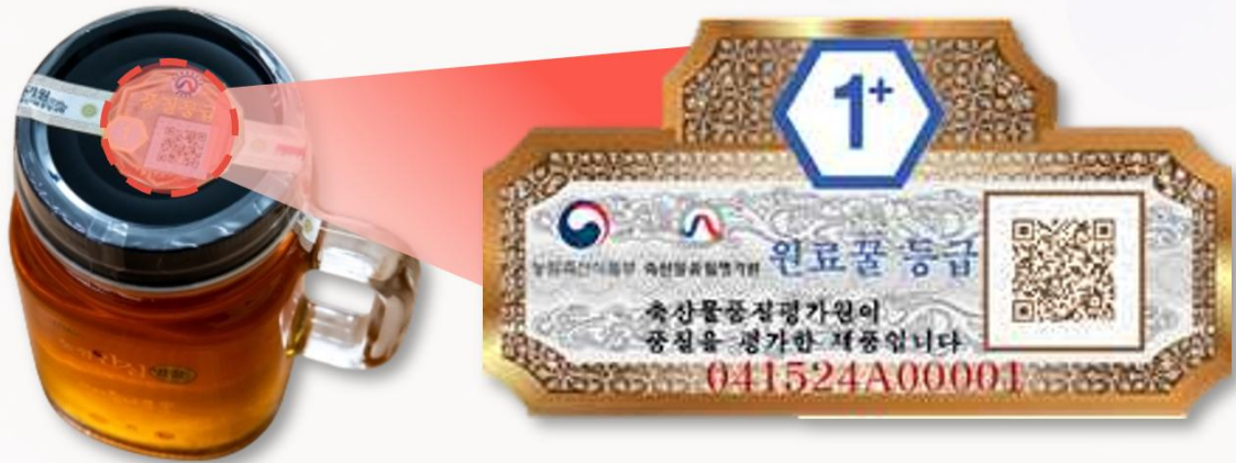
▲ 꿀 등급판정 라벨

꿀 등급제는 국내산 천연꿀의 품질을 평가해 1+, 1, 2등급 등으로 구분하는 제도입니다.