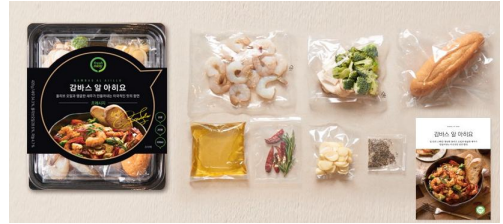
플라스틱용기(190mm x 145mm x 60mm)

준비한 재료 지퍼팩 그대로 1개, 현장에서 나누어 준 플라스틱 용기 1개 담아 심사